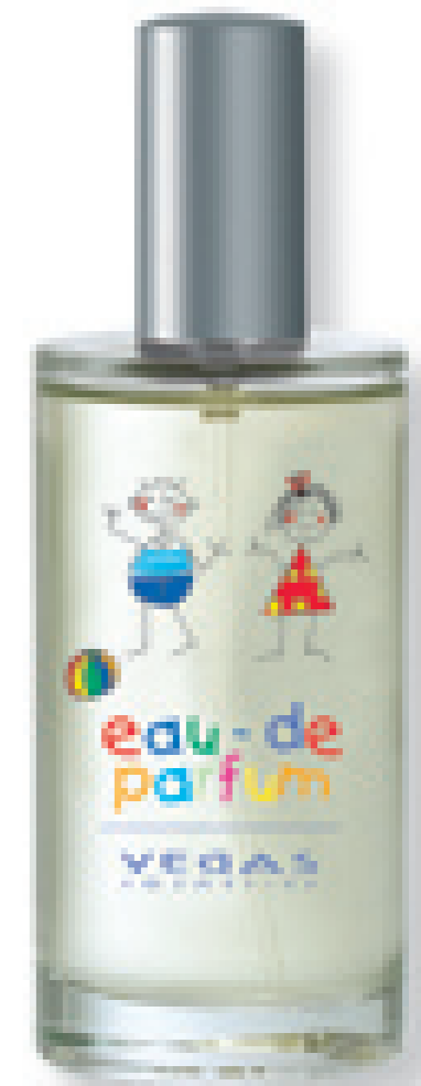
Eau de Parfum

As crianças têm fantasia e são creativas – tão fantásticas e creativas como este perfume! Frescura e frutos são as características principais da Kids Collection