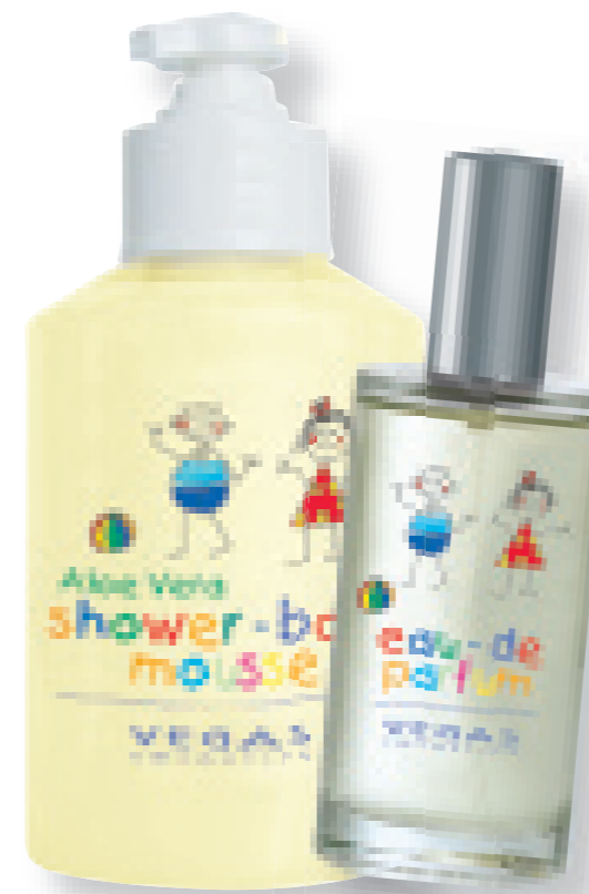
Conjunto de criança

Eau de Parfum, Gel de duche e de banho (incl. pequena oferta surpresa))