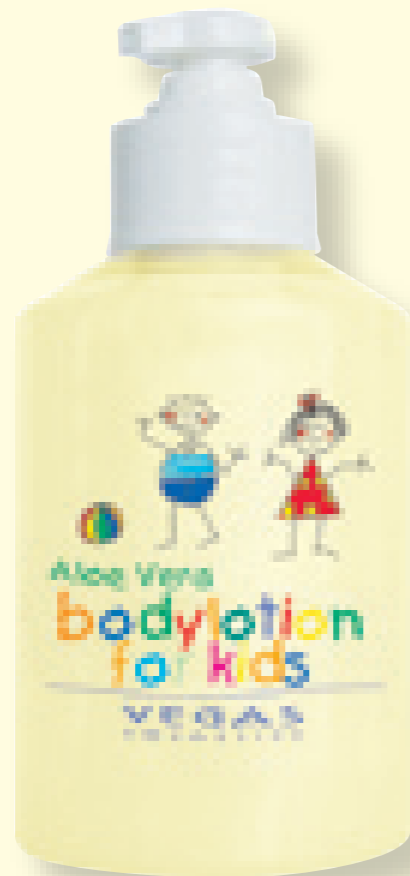
Loção corporal p/ criança com Aloe Vera

Loção corporal hidratante, especialmente para cuidar da pele sensível e seca das crianças. Torna a pele suave e macia. Contém: Aloe Vera, Bisabolol e Alantoin.