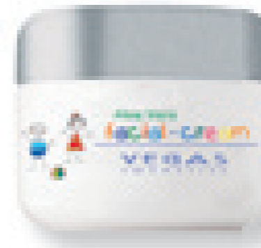
Creme facial para criança com Aloe Vera

Creme suave e hidratante com Aloe Vera, óleo de Jojoba e Abacate, especialmente concebido para a pele sensível das crianças. O tratamento perfeito para uma pele desidratada, seca e sensível.